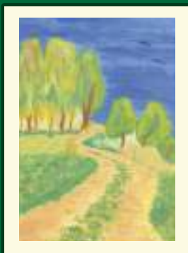
Ewelina Borzyszkowska - wyróżnienie